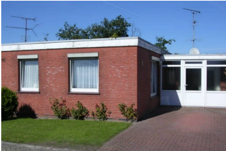
Hausansicht / Südseite